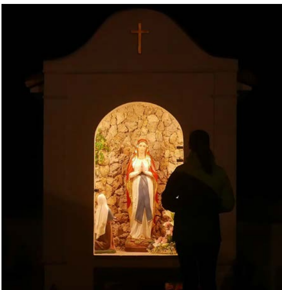
Kaplnka vo večerných hodinách