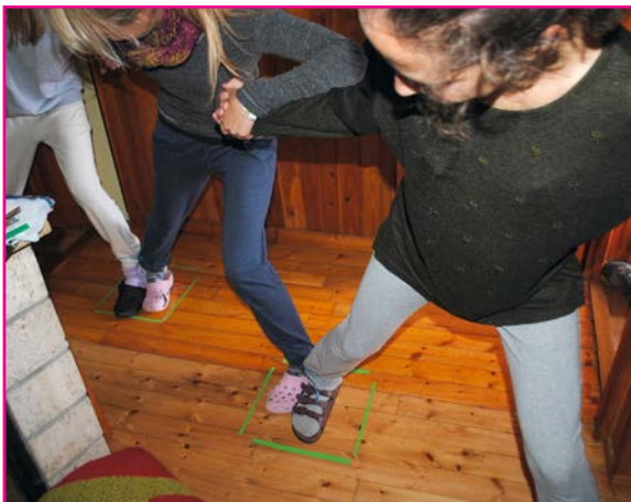
Animátori pri jednej z hier pre deti