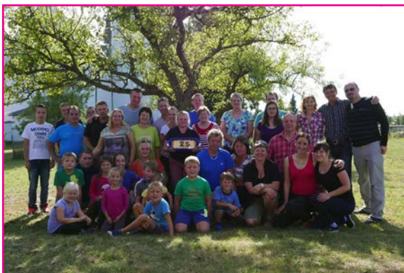
Naši speváci pri spoločnom stretnutí