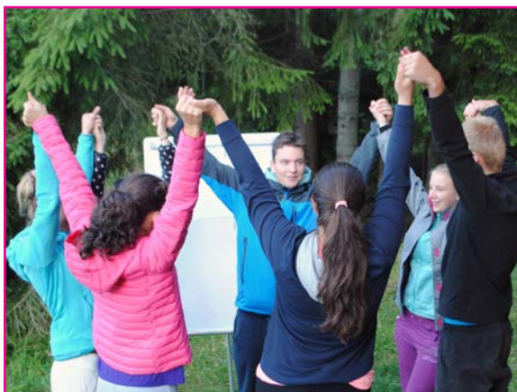
Animátori na sústreďení

V piatok poobede sme si sadli na terasu a vychutnávali vytúženú kávu. Konečne, všetko je pripravené. Naše nadšenie striedali už len drobné obavy z nastávajúceho počasia. Večer po svätej omši sme sa ponáhľali na chatu pripraviť večeru, kým neprídu mladí animátori. Na naše prekvapenie dorazili skôr, ako sme očakávali.