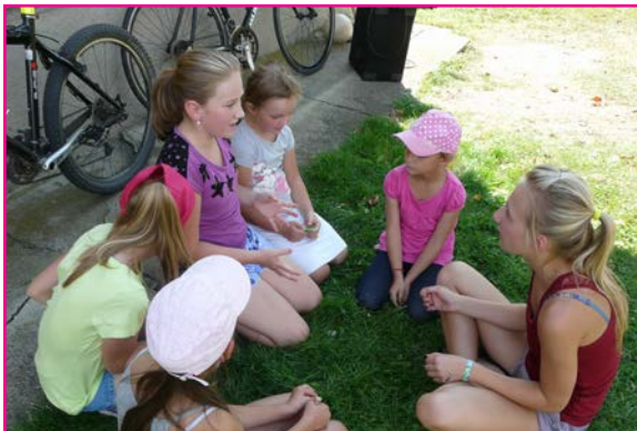
Z Bodky za prázdninami