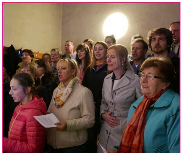
Naši speváci pri slávení svätej omše

Údaje o solnej bani sú čerpané z https://sk.wikipedia.org/wiki/So%C4%BEn%C3%A1_ba%C5%88a_Wieliczka