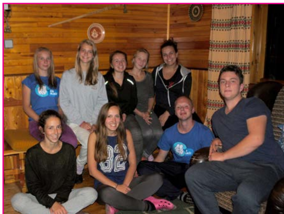
Animátori na sústreďení