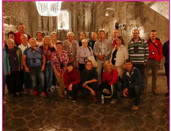
V Kaplnke svätej Kingy

Na sviatok Sedembolestnej Panny Márie sa náš bobrovecký spevokol vybral na výlet do Wieliczky pri Krakove. Navštívili sme soľnú baňu zapísanú v roku 1978 do zoznamu svetového a prírodného dedičstva UNESCO. Prehliadka bane trvala zhruba 2 hodiny, počas ktorých sme zdolali schody do hĺbky 64 metrov. Najväčším zážitkom pre nás bolo to, že sme si mohli zaspievať v Kaplnke svätej Kingy. Je to chrám vytesaný v hĺbke sto metrov pod zemou s krásnou výzdobou zo soli a s nádhernou akustikou. Po návšteve bane nám dobre padol obed v miestnej reštaurácii. Deň sme ukončili svätou omšou, pri ktorej sme sa poďakovali Panne Márii nielen za krásny výlet, ale hlavne za dvadsaťpäť rokov existencie spevokolu. Veľká vďaka patrí samozrejme aj nášmu duchovnému otcovi, ktorý nám výlet zorganizoval.