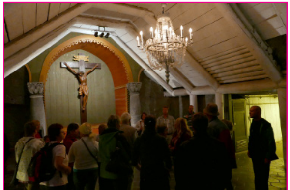
Naši speváci vo Wieliczke