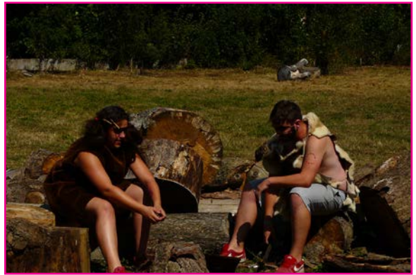
Z Bodky za prázdninami