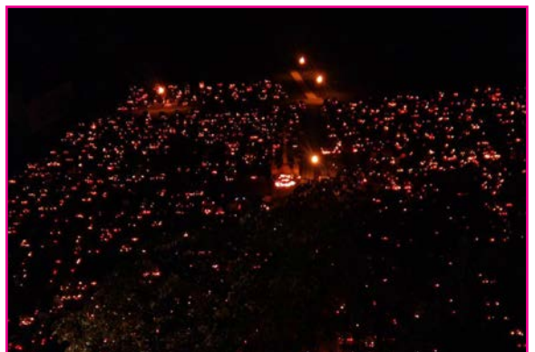
Cintorín počas dušičkového obdobia

Vinšujem, vinšujem, na šťastie, na zdravie, na Božie narodenie, ten starý rok prežiť, nového sa dožiť, hojnejšieho pokojnejšieho. Od Boha lásku, sto zlatých do mieška, plný dvor statku a po smrti kráľovstvo nebeské.