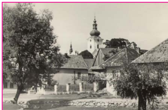
Pohľad na Bobrovec okolo roku 1950