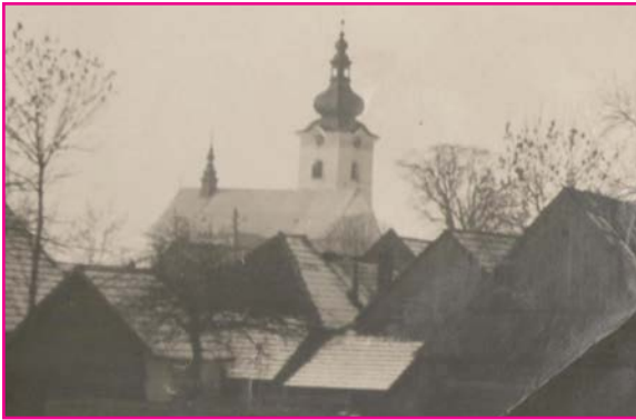
Pohľad na Bobrovec okolo roku 1950