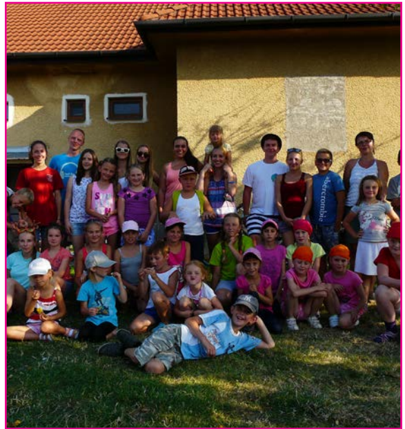
Deti na farskom dvore