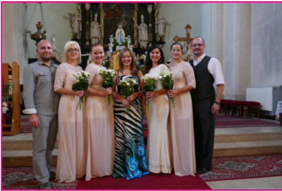
La Speranza v Bobrovci