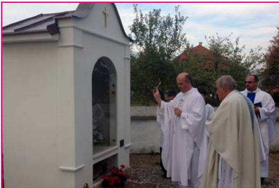
Požehnanie kaplnky