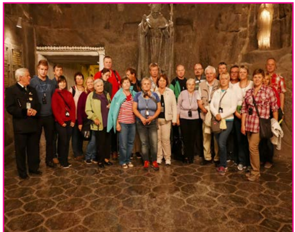
Pri soche svätého Jána Pavla II.